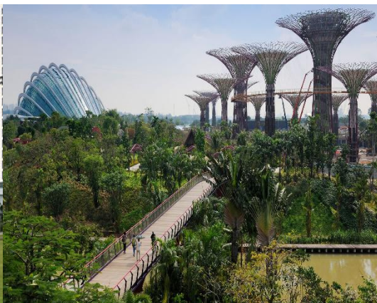
注：第一期学员参观国大大学城和实验室、国大大学城，滨海南花园