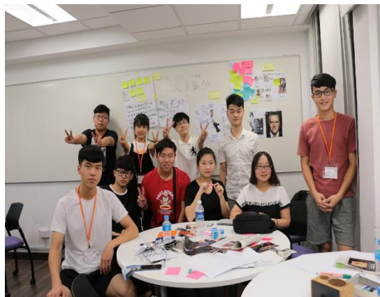
注：南洋理工大学校门、华裔馆、南大的Hive楼以及第一期设计思维课程