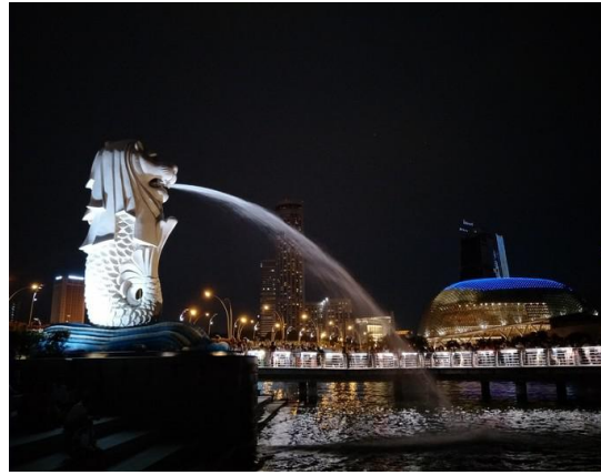
注：国大校门、第一期学员参观新加坡科技局、滨海湾夜景