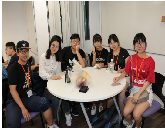
国大图书馆，操场，图书馆后花园以及第一期学员与博士生座谈